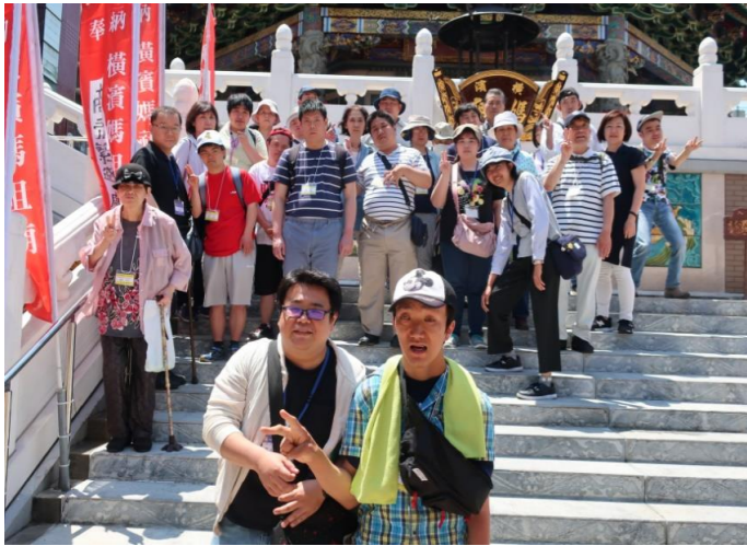
※横浜媽祖廟にて撮影

5月24日(金)に横浜中華街に行ってきました。天気にも恵まれたの楽しい散策となり横浜大世界ではトリックアートにビックリしたり、写真撮影で盛り上がりました。